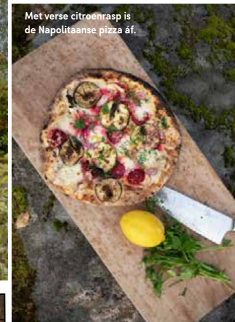
Met verse citroenrasp is de Napolitaanse pizza áf.