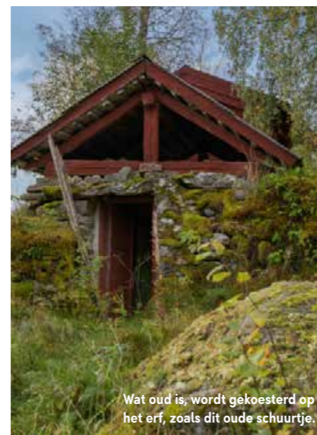
Wat oud is, wordt gekoesterd op het erf, zoals dit oude schuurtje.

Ons huisje-voor-één-nacht 'Sjön' staat, zoals de naam verklapt, aan de rand van een meer. Er hoort een kleine buitenkeuken bij die ingenieus is verstopt in een minicabin. Op het menu staat die avond pasta met verse paddenstoelen. Die mogen we zelf plukken in het bos. Jörgen wijst ons op het oranje goud, cantharellen, die in tapijtvorm de bosbodem kleuren. Net als knoepers van koninklijke 'Karl Johan' paddenstoelen, dat eekhoorntjesbrood blijkt te zijn. Met een uitje, knoflook en wat tomaatjes genieten we – zittend op ons bed – van een koningsmaal. De deuren van de cabin staan wijdopen en via het glazen dak zien we één voor één de sterren verschijnen. Als het helemaal donker is, duiken we vanuit onze privésauna zo in ons blootje het ijskoude meer in. "Hier komt toch helemaal niemand", heeft Elisabeth ons verzekerd, "Alleen de wilde dieren." Laten die nu nét op ons verlanglijstje staan. >