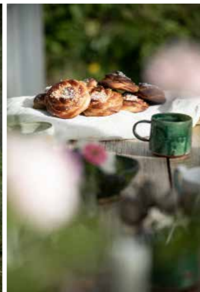
In de kas achter de bakkerij van Erikson Cottage kun je genieten van een 'fika' of een pizza.