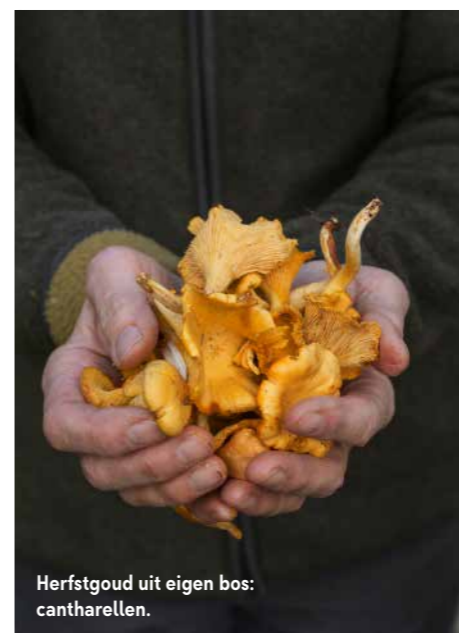
Herfstgoud uit eigen bos: cantharellen.