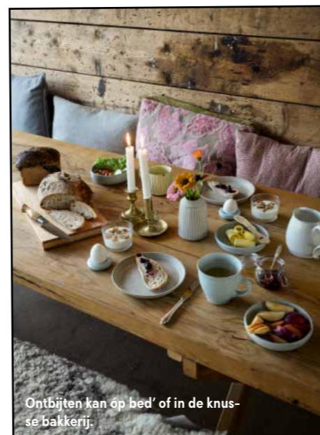
Ontbijten kan op bed' of in de knusse bakkerij.