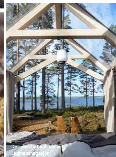
De cabin ligt pal aan het Lagmanshagasjön.