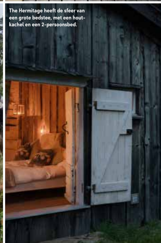
The Hermitage heeft de sfeer van een grote bedstee, met een houtkachel en een 2-persoonsbed.